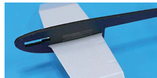
4. 앞날개 양쪽 아래 동체와 앞날개를 투명테이프로 붙여 고정한다.