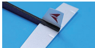
2. 수직꼬리날개에 붙어 있는 양면테이프의 종이를 떼고 뒤에서 볼때 동체의 오른쪽에 붙이고 눌러준다.