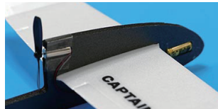
7. 모터부분을 투명테이프로 감아 붙여 고정한다.