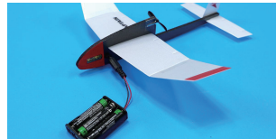
10. 충전기를 콘덴서 잭에 꽂아 충전한 다음 충전기를 빼고 날린다.

*주의사항 : 콘덴서잭에 충전기를 꽂고 뺄 때에는 동체가 부러질 수 있으므로 반드시 콘덴서 부분을 잡고 한다.