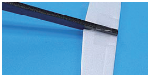
1. 수평꼬리날개를 동체 뒷부분의 홈에 끼우고 아래에서 투명테이프로 고정한다.