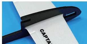
3. 비행기를 앞에서 보아 동체 왼쪽에서 앞날개를 동체 홈에 앞날개의 턱이 있는 곳 까지 끼운다.