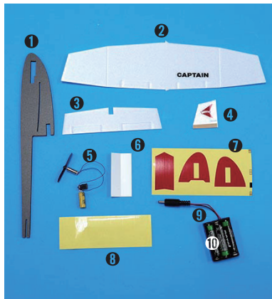
1. 동체 2. 앞날개 3. 수평꼬리날개 4. 수직꼬리날개 5. 모터세트 6. 상반각지그 7. 스티커 8. 투명테이프 9. 충전기 10. 배터리