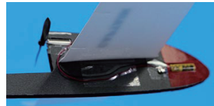
9. 콘덴서와 모터사이 선을 동체에 투명테이프를 붙여 고정한다.