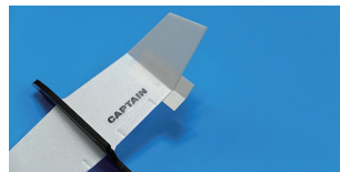
5. 앞날개의 양쪽 접는 선을 따라 접은 다음 상반각지그에 대고 각도를 맞춘 다음 투명테이프로 고정한다.